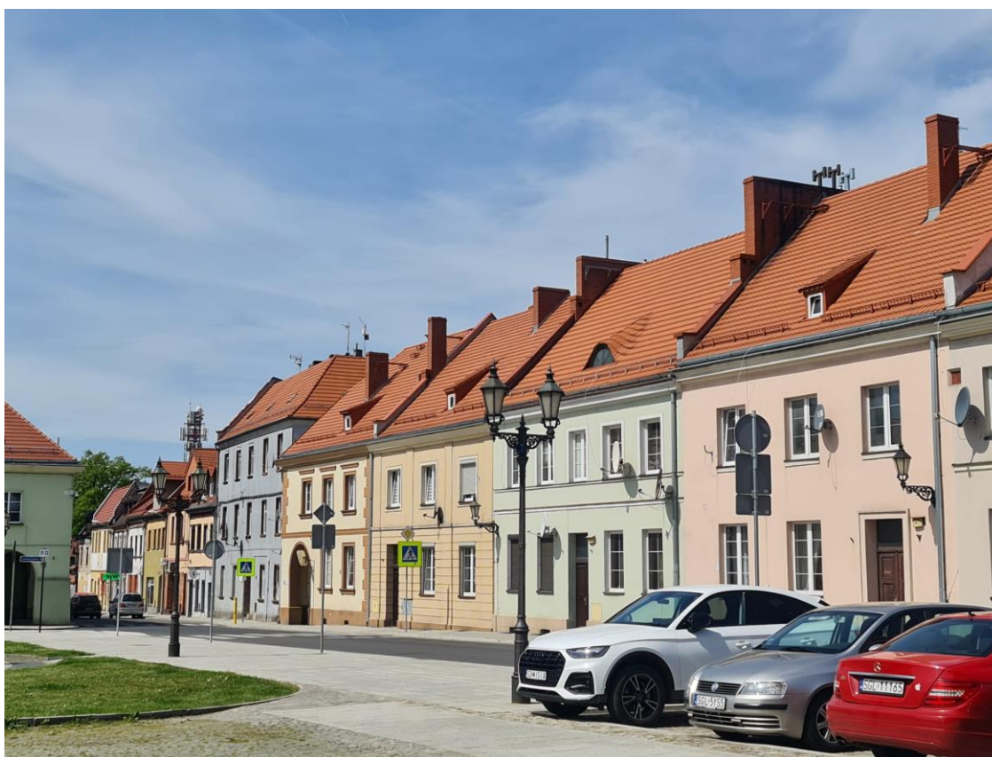
Odnowiona pierzeja Rynku w Pyskowicach