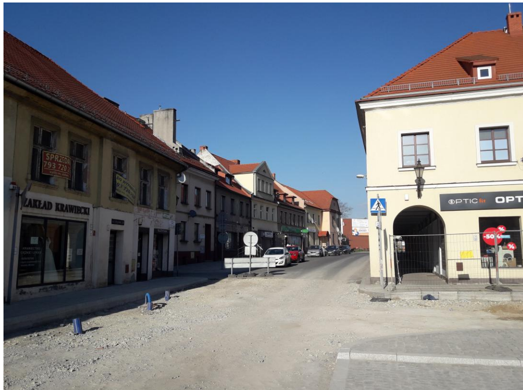
Rynek w Pyskowicach i fragment pierzei północnej. Ulica wychodząca z rogu kwadratowego placu.