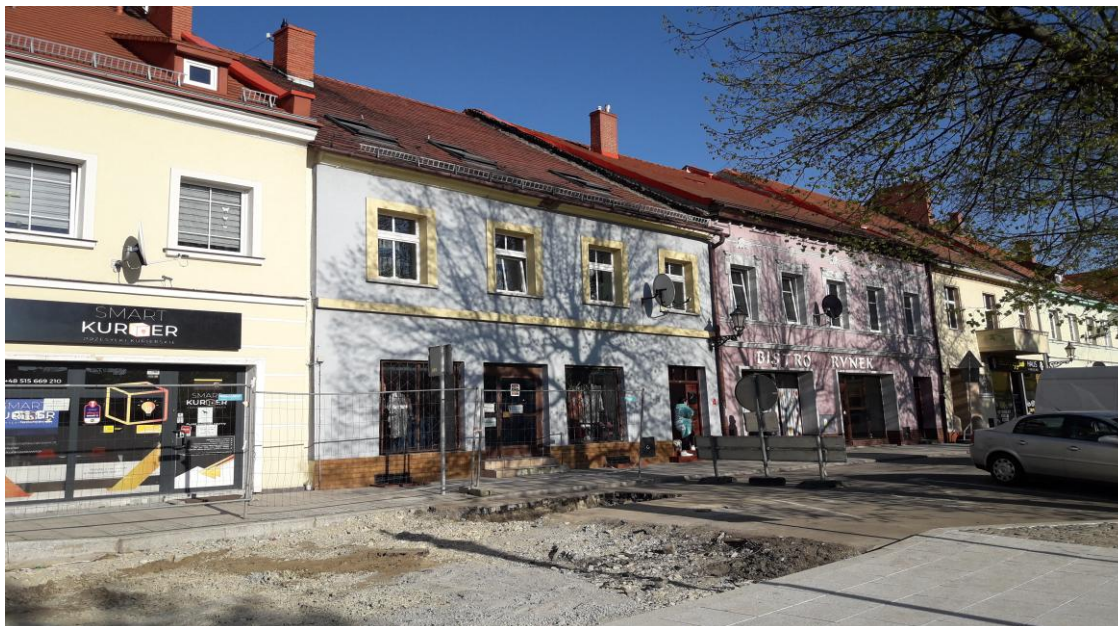
Rynek w Pyskowicach, pierzeja wschodnia. Lekkie pastelowe kolory tworzą harmonijną całość.