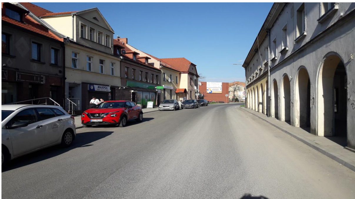
Ulica łącząca Plac Wyszyńskiego z rynkiem w Pyskowicach. Historyczny układ przylegających do siebie domów o podobnej wysokości.